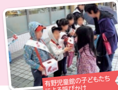
有野児童館の子どもたちによる呼びかけ

募金活動の期間は3月末までです。街頭での募金の呼びかけに出会いましたら、どうぞご協力の程よろしくお願いたします。