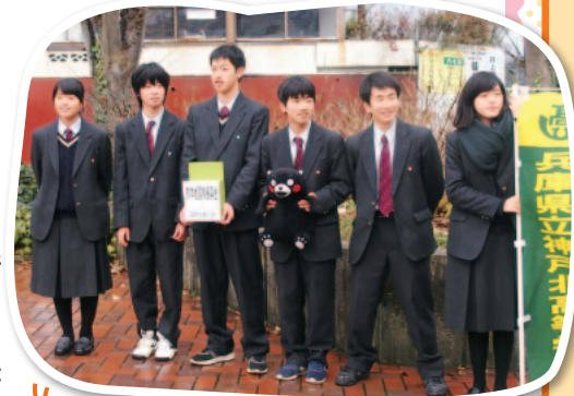
熊本地震支援のための募金活動の様子

高校生シリーズはこれで終了です。素直で真つすぐな心を持ち続けて、今後も活動や学生生活を充実させてください。各校の皆さまご協力、誠にありがとうございました。