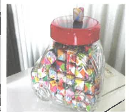
約1.5cm角のくす玉をたくさん作りピンに入れて飾られています。